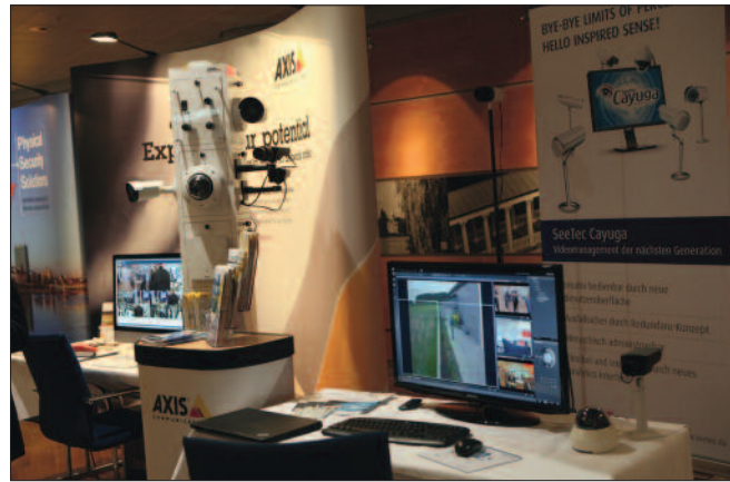
VfS-Kongress: 50 Aussteller präsentierten ihre Produkte.

Drohnen. „Pro Monat werden 300.000 Drohnen an gewerbliche und private Kunden verkauft“, sagte Dr. Ingo Seebach ( Dedrone GmbH , www.dedrone.com ). Systeme mit einer Traglast von 5 kg und einer Reichweite von 5 km sind für unter 2.000 Euro über das Internet erhältlich. Drohnen – als Multikopter im Durchmesser von 10 cm bis 2 m – können