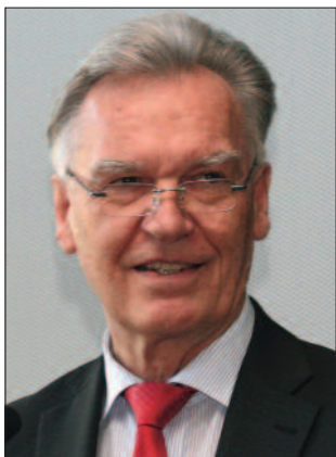
Jörg Ziercke: „Der Lackmustest für die Sicherheitsstrukturen ist, wie nach den Anschlägen in Europa dem Islamismus begegnet wird.“

für Unternehmen jeder Art. Als Form des Identitätsdiebstahls wurden im Frühjahr 2014 zunächst 16 Millionen und dann nochmals 18 Millionen Zugangsdaten zu Online-Shops und -Konten gestohlen. Durch gefakte Rechnungen von Telekommunikationsunternehmen wurden innerhalb von drei Wochen über 200.000 Konten kompromittiert.